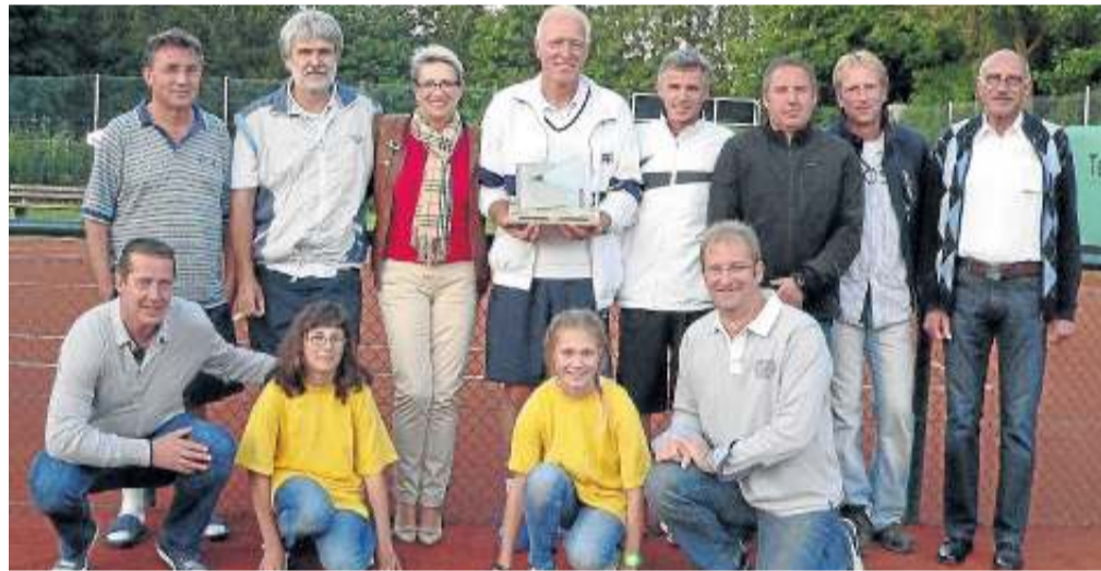
Ausrichter und Sieger des Alme-Cups freuen sich gemeinsam über ein gelungenes Turnier.

Das Finale, das in zwei Sätzen gespielt wurde, entschied Anröchte gegen Deiringsen mit 6:2 und 6:4 klar für sich.