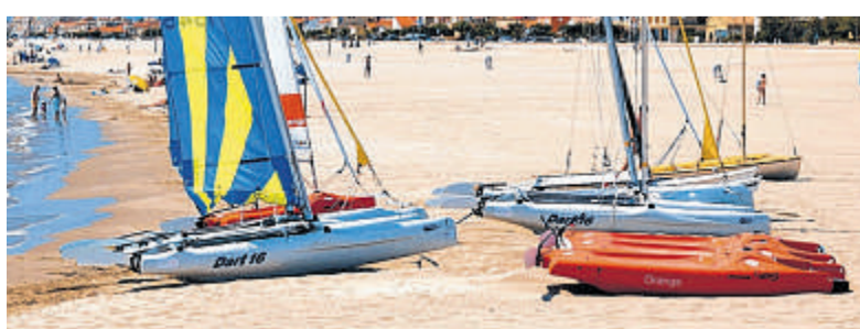
Mit dem Kreis-Sport-Bund im Sommer ans Mittelmeer: Windsurfen und Katamaransegeln gehören unter anderem zu den Freizeitangeboten.